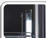
Lampe LED interne verticale