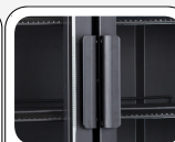
Poignée externe en aluminium